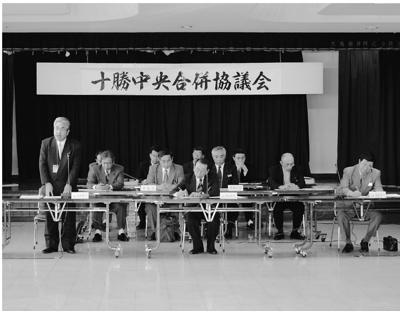
▲ 第12回十勝中央合併協議会(幕別町札内福祉センター)