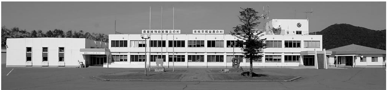
忠類村役場 忠類村字忠類439番地の1 地上2階 昭和51年竣工