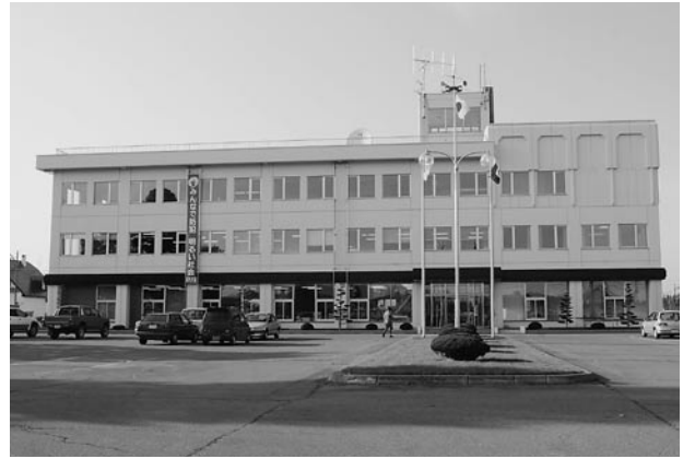
更別村役場 更別村字更別南1線93番地 地上3階 地下1階 昭和55年竣工